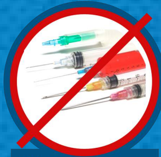
الأدوات الحادة والإبر