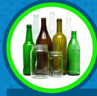
القوارير والجرات الزجاجية