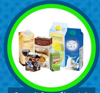
العلب الكرتونية الخاصة بالأغذية والمشروبات

الرجاء إبقاء المواد منفصلة ونظيفة وجافة، وتسطيع الصناديق الكرتونية.