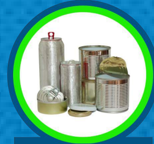
العلب المعدنية الخاصة بالأغذية والمشروبات