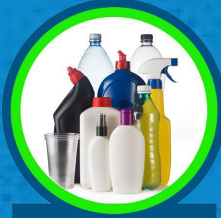
الزجاجات والحاويات البلاستيكية