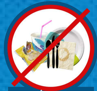
المعدات التي تُستخدم مرة واحدة

أعد تدوير الأكياس البلاستيكية والأغلفة من متجر البقالة المحلي *