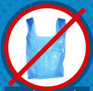
الأكياس والأغلفة البلاستيكية*